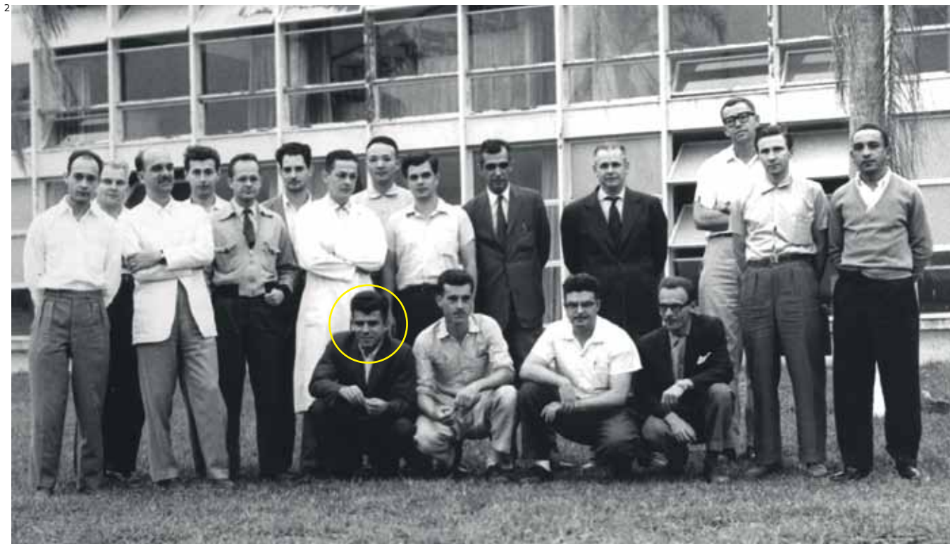
O físico (no destaque), ao lado de professores do ITA no início dos anos 1960

seguida para fazer o doutorado em física na Universidade Johns Hopkins, em Baltimore. De volta ao Brasil, em 1954, iniciou sua carreira como professor de mecânica estatística no Departamento de Física do Instituto Tecnológico de Aeronáutica (ITA), em São José dos Campos, interior de São Paulo.