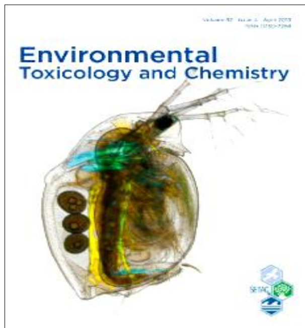
Figura 3. Capa da Revista Environmental - Toxicology and Chemistry, 2013.

A tese de Holtz denominada " Desenvolvimento de nanoestruturas de vanadatos de prata, cério e bismuto e avaliação como novos agentes antibacterianos " foi defendida no IQ-Unicamp em 2012 [8].