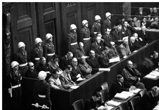
Julgamento de Nuremberg.

Primeiro documento de caráter universal a estabelecer uma normativa para os procedimentos da pesquisa, reconhecendo o rigor ético como condição sine qua non para a validade dos experimentos científicos.