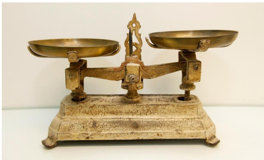
Farmácia Universitária.

O equilíbrio entre essas duas instâncias - o saber, que tende ao ilimitado, e a virtude, que impõe limites - caberia à razão humana, a qual estabelece “o critério para delimitar elementos por si mesmos ilimitados.” ( República , l. VI).