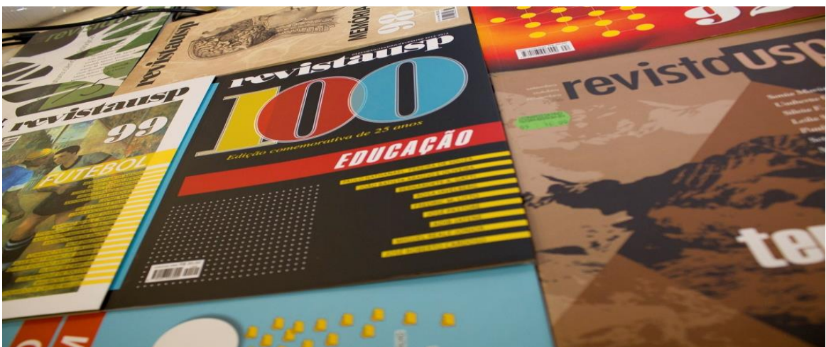
Centésima edição da Revista USP.