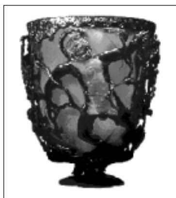
Figura 1. Taça de Licurgo: uma das mais famosas antiguidades romanas, data do século IV d.C. Fabricada com vidro contendo nanopartículas de ouro (7), pelos “velhos nanotecnologistas”. As partes escuras correspondem ao bronze e as claras onde se encontra o vidro ruby .

Pequenas partículas metálicas, dispersas no vidro, absorvem a luz e, desta maneira, podem apresentar cores vivas. Tal vidro é conhecido desde o século XVII (o que mostra que a nanotecnologia não é tão jovem!), sendo que o efeito ocasionado pela presença de partículas finamente divididas, em 1857, já fora reconhecido por Faraday (6). O tamanho das partículas de ouro (que, agora sabemos, são nanopartículas) influencia a absorção da luz. Partículas maiores que 20 nm de diâmetro deslocam a banda de absorção para comprimentos de onda maiores que 530 nm, ao passo que partículas menores geram um efeito contrário, ou seja: deslocam a absorção para menores comprimentos de onda. Assim, graças ao tamanho, é possível ter partículas com diferentes cores (laranja, púrpura, vermelho ou verdes), desde que seja capaz de controlar a distribuição do seu tamanho. A cor característica do vidro ruby é a vermelha, que corresponde a uma absorção de comprimento de onda por volta de 530 nm, logo com partículas da ordem de 20 nm. Neste exemplo fica evidente a questão das propriedades dependentes de tamanho, as quais, já assumindo o jargão da nanotecnologia, denominamos nanopartículas, pontos quânticos ( quantum dots ) ou nanopontos ( nanodots ) e o efeito, chamamos de efeito quântico de tamanho ( quantum size effect ). Na Figura 1, é apresentada a famosa peça romana, Taça de Licurgo, confeccionada com vidro ruby e bronze.